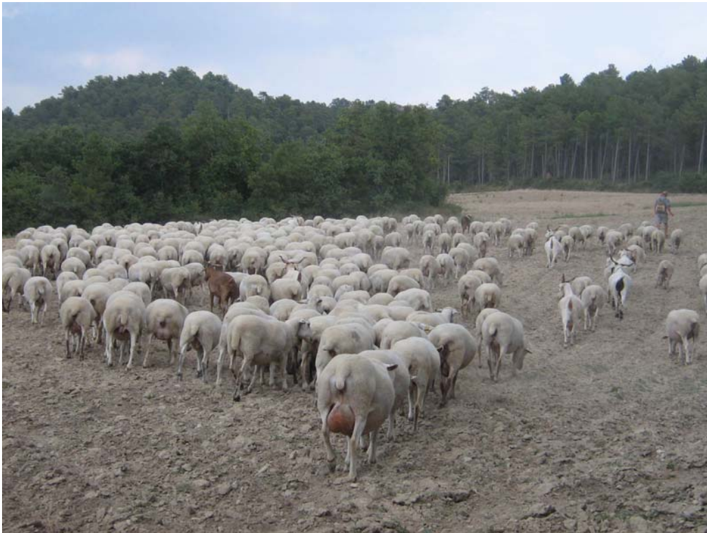
Ramat al Solsonès.