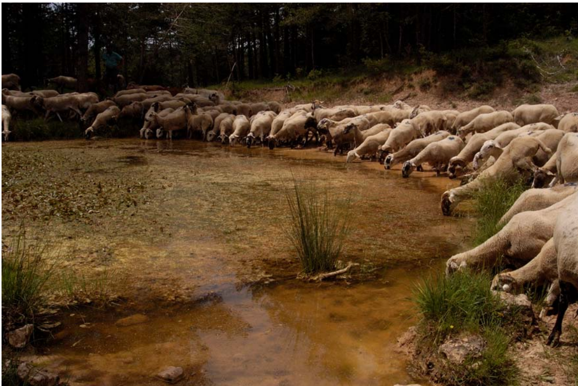
Ramat abeurant als voltants de Llentes.

Les vies pecuàries han estat uns camins que han fet de connectors entre diferents medis vegetatius i climàtics. D'altra banda, aquests corredors tenien la vital funció de ser unes pastures allargassades per alimentar al bestiar en els llargs èxodes estacionals. Encara que totes les vies pecuàries tinguin la missió de canalitzar el trànsit de bestiar, sí que trobem determinats camins que tenen altres funcions ramaderes. Una d'elles és l'anar abeurar el bestiar. Dins de la xarxa de diferents abeurades, tant d'ús privat com col·lectiu, trobem camins ramaders que la seva única finalitat és aquesta, portar el ramat a un lloc per beure aigua. En molts casos es poden trobar petites desviacions del camí principal per accedir al punt d'aigua.