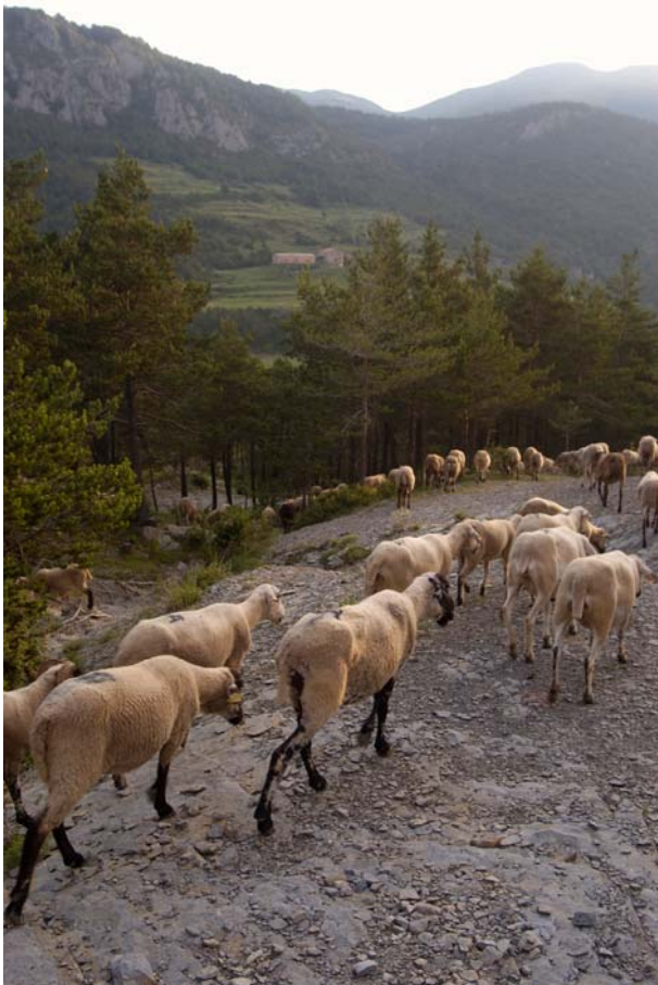
Ramat als voltants de Castellar de n'Hug.

D'altra banda, també trobem camins transversals que normalment són de caràcter comercial. Aquests, a diferència dels de caire més ramader, van de est a oest de les diferents conques hidrogràfiques fins arribar al seu destí.