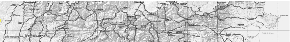
Camins ramaders de Catalunya. Eixos principals 1:500 000