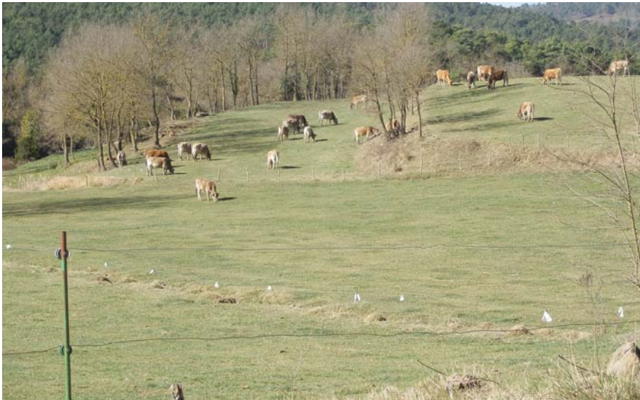
Ramat pasturant a Sant Agustí de Lluçanès.

Per definir aquells desplaçaments de ramats de bestiar a nivell municipal o comarcal, s'utilitza el terme transtermitància . Aquests moviments de bestiar es poden donar per dos motius principals. El primer per anar a buscar les pastures dins del mateix àmbit del ramat realitzant moviments altitudinals dins de la mateixa vall on viu el ramat. Segon, per desplaçar el ramat per aprofitar conreus i guarets.